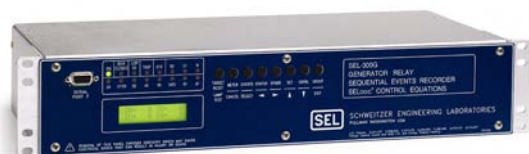
Figura 8—A proteção dos geradores é fornecida por dois Relés SEL-300G, que também incorporam recursos importantes de medição e emissão/registro de relatórios de evento, além de proteção térmica em conjunto com os RTDs.

O esquema de monitoração de temperaturas do SEL-2600A aplicado na represa e usina é usado para as funções de trip e alarme de cada SEL-300G. Os dados das temperaturas são transmitidos para o sistema de controle de dados da usina via comunicação Modbus®, a partir do SEL-300G para a unidade terminal remota da usina. Os dados da temperatura do estator são disponibilizados localmente e no centro de controle principal localizado a mais de 60 milhas de distância.