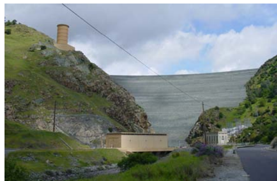
Figura 1—A estrutura da represa é formada por terra e pedras, com mais de 600 pés de altura e 1.500 pés de largura na crista.

estabilidade do sistema de potência. Tais usinas ajudam a compensar as variações de geração e dos fluxos de transmissão que ocorrem durante emergências.