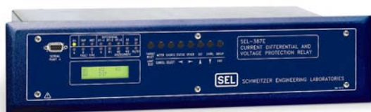
Figura 4—Dois Relés SEL-387E são instalados para fornecer um sistema abrangente de proteção, medição e emissão de relatórios de evento dos transformadores elevadores da usina.

Os principais componentes do projeto de upgrade incluem dois Relés SEL-387E, instalados para fornecer um sistema abrangente de proteção, medição e emissão de relatórios de evento dos transformadores da usina. A proteção dos geradores é fornecida por dois Relés de Geradores SEL-300G, que também incorporam recursos importantes de medição e emissão/registro de relatórios de evento, além de proteção térmica em conjunto com os RTDs.