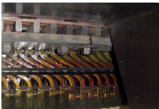
Figura 6—A temperatura máxima (“hot spot”) estava localizada nos tampões de fechamento (“endcaps”) do enrolamento do estator do gerador e o calor era irradiado na direção dos RTDs localizados acima.

esse propósito não estava instalado no ponto da temperatura máxima (“hot spot”) do gerador. O ponto da “hot spot” estava localizado nos tampões de fechamento (“endcaps”) do enrolamento do estator do gerador e o calor era irradiado na direção dos RTDs localizados acima. Não havia recursos de coleta de dados através do RTD conectado ao relé; portanto, eles não tinham qualquer informação sobre o que ocorria naquele RTD. O cliente considerou efetuar a troca do RTD que estava sendo monitorado pelo relé existente; porém decidiu, ao invés disso, instalar a tecnologia da SEL, a qual pode propiciar alarmes e abertura através de todos os RTDs simultaneamente”, explica Rauch.