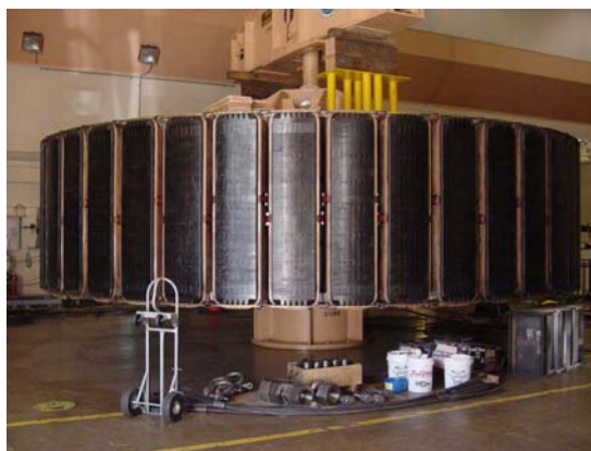
Figura 5—Turbina hidrogeradora de 150 MW.

“O cliente escolheu o Módulo de RTDs SEL-2600A pois ele não requer calibração anual, ou manutenção, resultando na simplificação da fiação dos RTDs. Uma simples interconexão via cabo de fibra óptica entre o SEL-2600A e o Relé SEL-300G fornece todos os dados de temperatura necessários para os recursos de proteção e alarme do Relé SEL-300G”, explica Greg Rauch, engenheiro de aplicação da SEL.