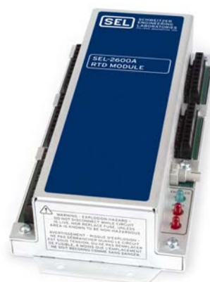
Figura 7—O Módulo de RTDs SEL-2600A usado para fonte de energia AC mede até 12 temperaturas dos RTDs, mais um contato de entrada. O link de fibra óptica propicia imunidade aos ruídos elétricos e isolamento de terra entre os dispositivos. O Módulo de RTDs SEL-2600D é disponibilizado para fontes de energia DC.

120 ohms e cobre de 10 ohms. O SEL-2600A é uma substituição totalmente compatível para o SEL-2600 e fornece uma nova tecnologia para rejeição de ruídos com patente pendente. Os links de fibra óptica eliminam o lançamento de cabos de alto custo e propiciam imunidade aos ruídos elétricos e isolamento de terra entre os dispositivos.