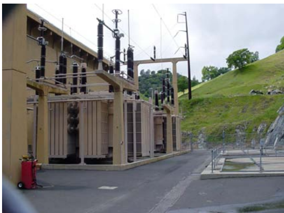
Figura 3—Os transformadores da usina de energia hidrelétrica são protegidos e monitorados pelos Relés de Proteção de Tensão e Diferencial de Corrente SEL-387E.

A estrutura da represa é formada por terra e pedras, com mais de 600 pés de altura e 1.500 pés de largura na crista. Localizada sobre a terra, na represa, a usina abriga duas turbinas hidrogeradoras de 150 MW, que geram mais de 360 milhões de quilowatts-hora de eletricidade. A potência gerada nessa usina de pico atende às necessidades da área próxima, sendo a energia restante comercializada através da rede para os consumidores localizados fora da área.